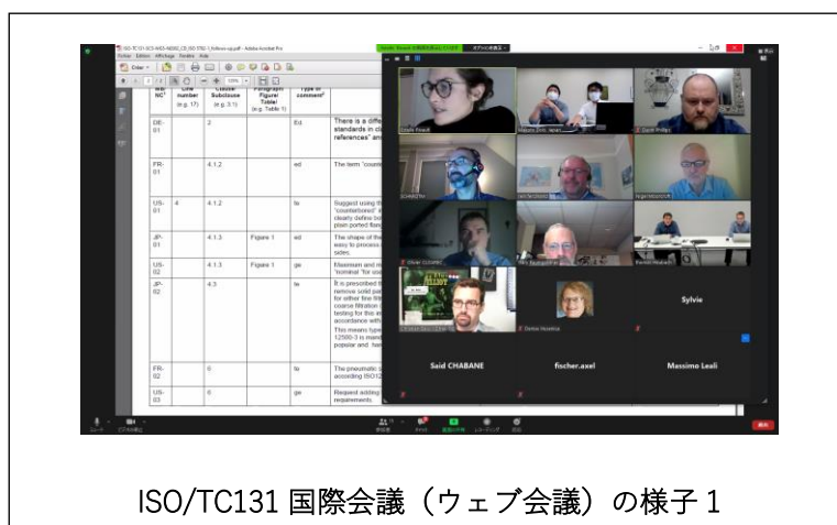
ISO/TC131 国際会議（ウェブ会議）の様子 1

①今年度は、新型コロナウイルスの影響により、ISO/TC131国際会議（ウェブ会議）のみに参加し、日本の意見の反映に努めた。 http://www.jfpa.biz/PDF/JKA2020M-033.pdf また、発行されたISO審議案件132件についてすべて回答し、日本の意見の反映に努めた。